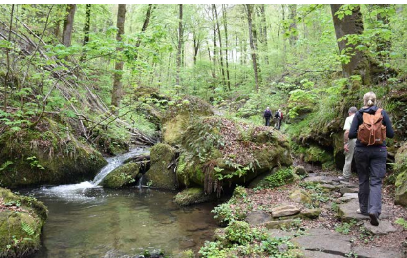
Op weg naar het Hallerbachtal