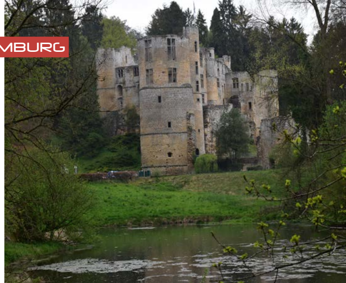
De 12 e -eeuwse burchtruiene van het slot van Beaufort is een bezoek waard