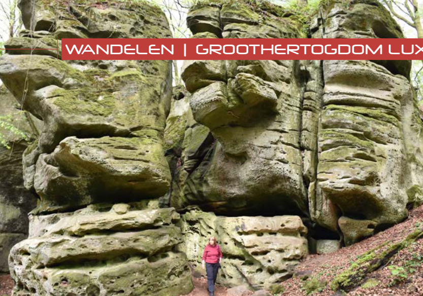
Op de grillige rotsformaties raak je maar niet uitgekeken