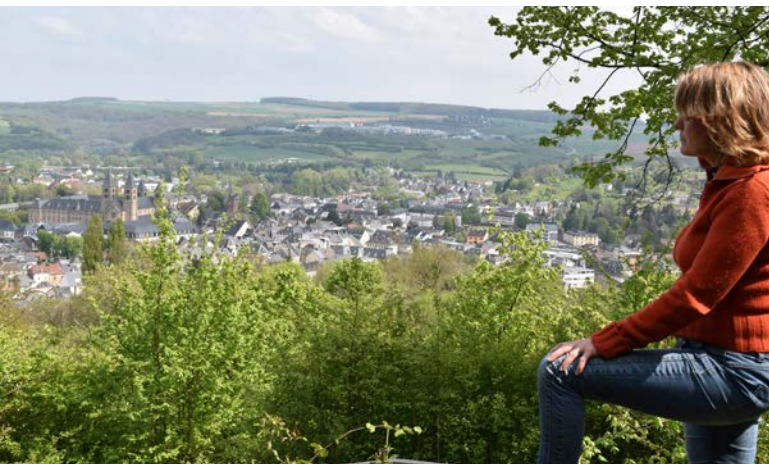
Zicht op de toeristische trekpleisters van het charmante Echternach

De hotelier van Le Bon Repos in Scheidgen had ons gewaarschuwd: route 2 van de Mullerthal Trail is de zwaarste, maar ook wel de avontuurlijkste. Bij het ontwaken voelen onze kuitspijeren stram, na een dagje stevig doorstappen. Vandaag lopen we vanuit Berdorf naar Müllerthal, het dorp dat haar naam ontleende aan de hele omgeving. De meeste toeristen kennen het plaatsje omwille van het beroemde houten bruggetje over de Ernztal en de Schiessentümpel, een kleine maar zeer schilderachtige waterval. En dan loopt het steil omhoog, het bosgebied van Schnellert in, waarbij we de uitstekende bewegwijzering (een rode M op een wit vlak) perfect kunnen volgen. Meteen beginnen klimmen is helemaal niet saai, want de route voert ons andermaal naar de fascinerende rotsformaties, die alle iets weg hebben van dieren- of trollenfiguren. Zo is er de Binzeltschlüff: af en toe moeten we er zelfs letterlijk doorheen of erover via een resem bruggetjes. Het loont de moeite om hier wat tijd te nemen om de rotsen te observeren, waarna het verder gaat langs de Predigtstuhl en de Werschrummschlüff. >>