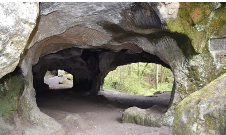
In Hohlay werden vroeger molenstenen uit de holten van de rotsmuren ontgonnen